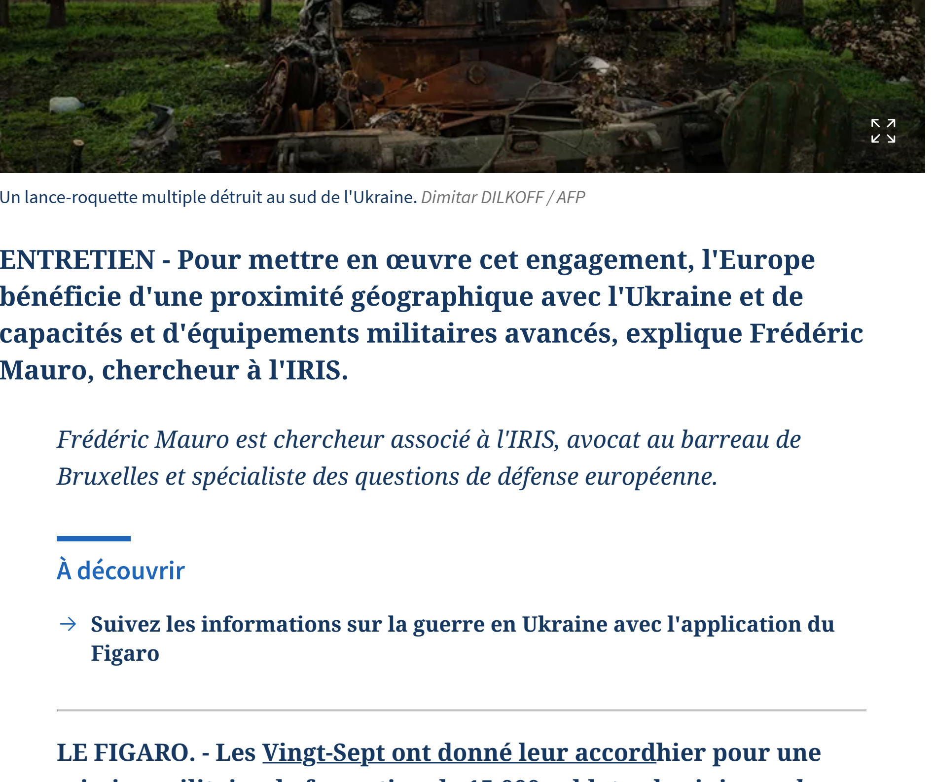
Un lance-roquette multiple détruit au sud de l'Ukraine.

ENTRETIEN - Pour mettre en œuvre cet engagement, l'Europe bénéficie d'une proximité géographique avec l'Ukraine et de capacités et d'équipements militaires avancés, explique Frédéric Mauro, chercheur à l'IRIS.